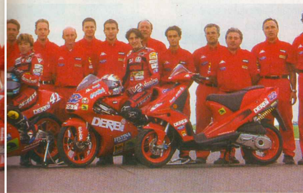
La fábrica Piaggio (arriba), la familia Rabasa (centro) y el equipo de Derbi. A partir de ahora, fuerzas unidas.

Nuevos vientos soplan para la industria europea, tú como yo estarás harto de oír hablar de convergencia, de euros, de globalización, y hay que felicitarlo porque la nueva singladura emprendida por Derbi debe conducirla a superar cualquier tipo de problemas y asentarse sólidamente en el futuro.